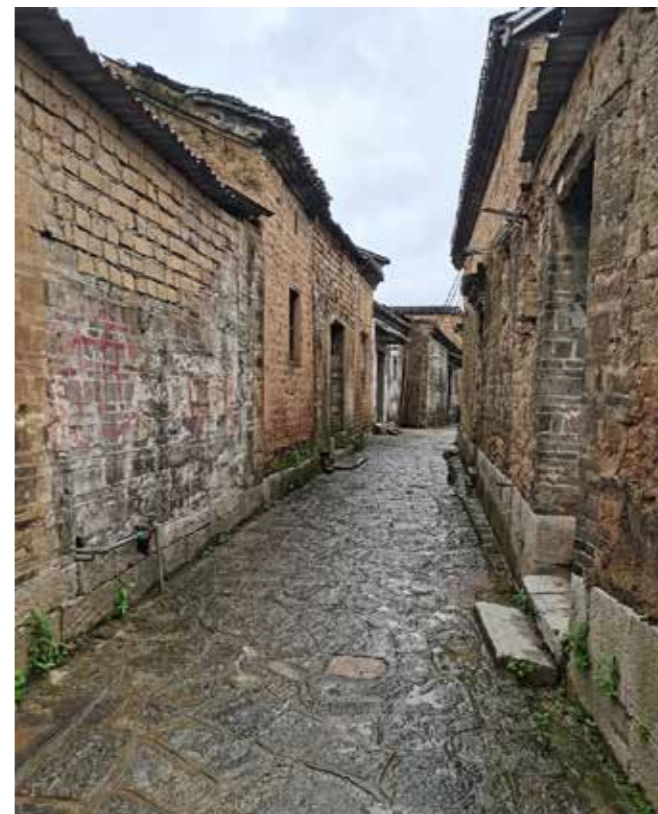
桂林市草坪回族乡潜经村干净整洁的村道

以桂林市草坪回族乡为例，其污水、垃圾处理能力还处于起步阶段，缺乏系统、完善的动态监控管理平台，存在保障不足、新旧生态风险交织等问题，生态保护建设和管理能力还需进一步完善。现有科技资源、基础研究和前沿技术开发相对落后，融合少数民族生态资源与社会经济发展的新思路有待进一步挖掘。生态环境的保护和修复技术仍不成熟，生态领域的人才政策体系、环保技术评价体系、推广示范先进技术的共享平台还需进一步完善，生态文明建设的政策法规也需要引起进一步重视。