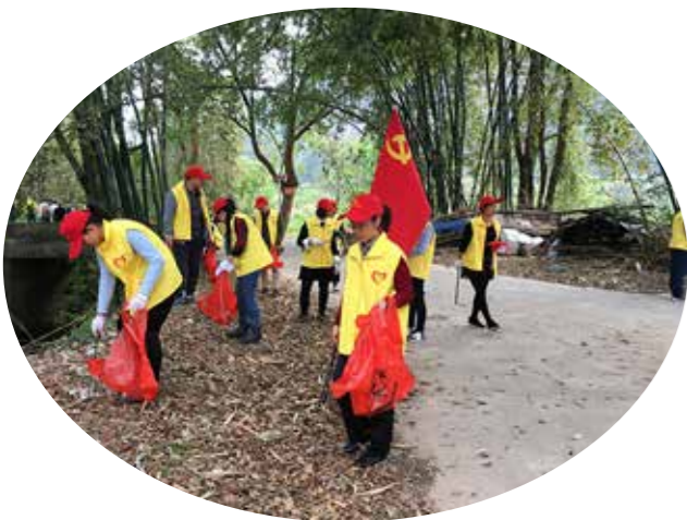
志愿者们在清理路边垃圾