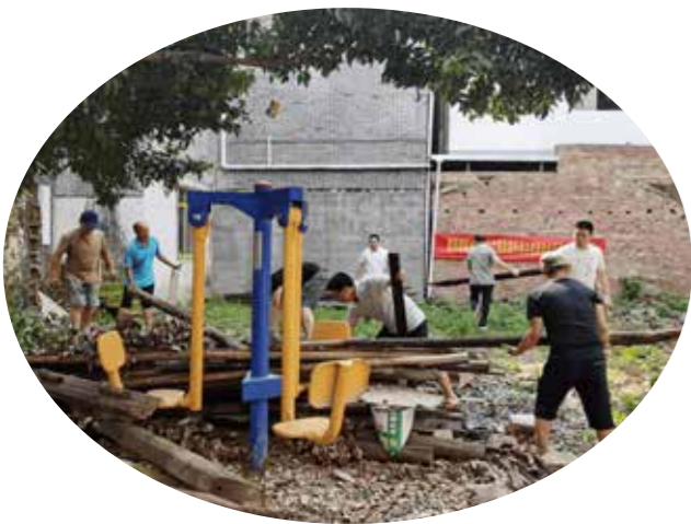
基层干部和群众在清理建筑垃圾

长期以来，我国乡镇建设将主要精力集中于完善服务业的基础设施，对于垃圾处理等环保设施建设投入不足。而民族地区由于资金、人员有限，基层环境管理机构比较薄弱，缺乏相应的配套设施管理，环境执法人员素质偏低，社会组织和民众参加污染防治法规知识的宣传、环保执行行动和调查的机制较少，缺乏生态公益诉讼和社会环保机构运行的相关规章制度。