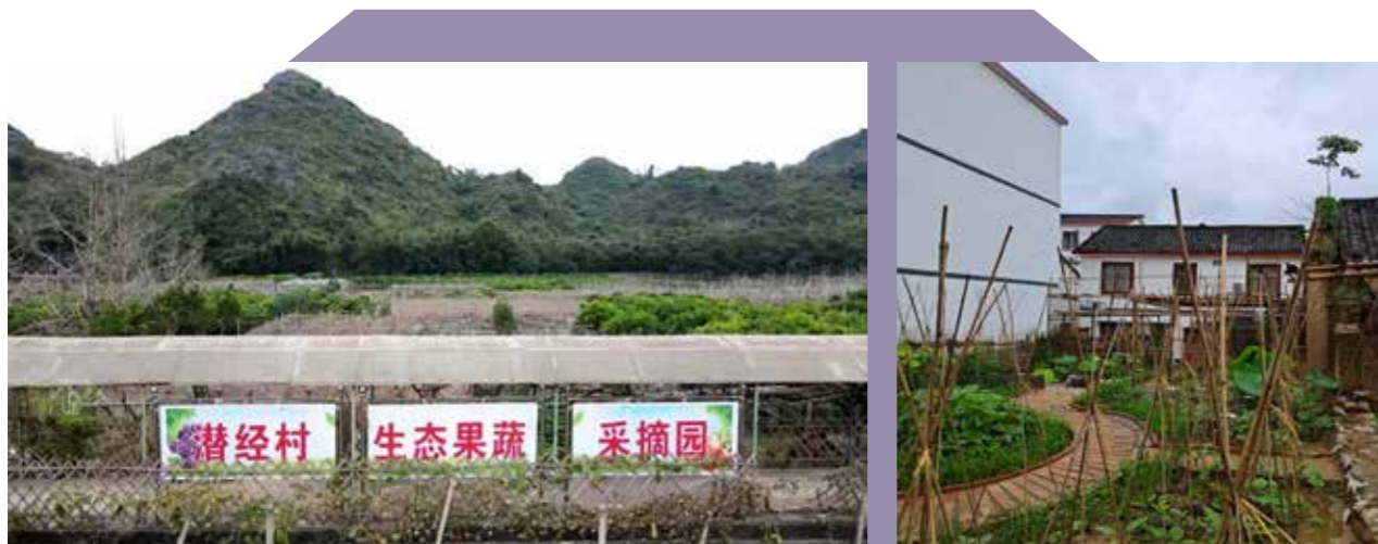
桂林市草坪回族乡潜经村生态果蔬采摘园

完善生态价值体系构建需要全体社会成员具有“人与自然生命共同体”理念。公民的环境素质是完善价值体系构建和促进生态文明建设的关键。良好的氛围有利于促进生态文明建设，全方位融入社会生活，发挥新媒体、新技术的宣传作用，开拓多种渠道营造人与自然和谐共生的浓厚氛围。与此同时，草坪回族乡通过回族文化的生态道德构建生态价值体系，加强生态文明宣传教育，在少数民族干部培训体系中增强生态文明建设，提高干部的素养，并进一步丰富群众性精神文明创建活动。现代生态危机促使人民群众生态意识觉醒，生态文明理念融入人们的思想，外化于人们的行动，并自觉约束自己的思想和行为来促进生态的平衡发展。