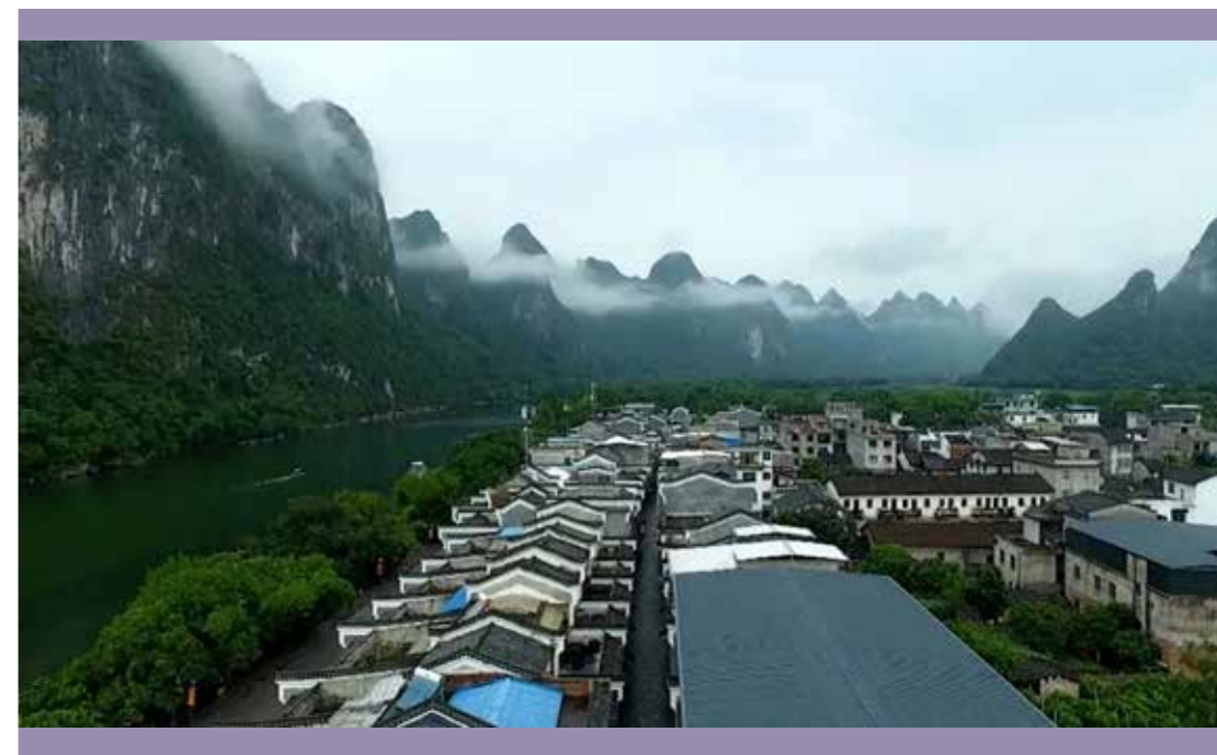
桂林市草坪回族乡整洁的街道

生态宜居是乡村振兴的内在要求，“生态”即人与自然和谐相处，“宜居”即满足人民群众对整洁家园的需求，生态的发展在于乡村，乡村的发展活力依靠生态。在乡村振兴背景下，民族地区生态环境的保护和治理关系到社会经济的可持续发展，直接影响当地群众的生活环境和子孙后代的健康。由于我国民族地区经济发展水平存在差异及多方面因素的影响，生态环境问题日益突出，唯有优化民族地区生态文明建设路径，才有利于促进生态环境可持续发展和帮助少数民族群众增收致富。