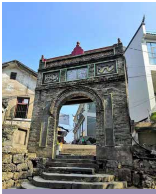
图4 桂林阳朔福利古镇