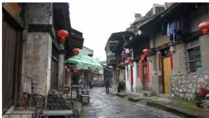
图2 桂林大圩古镇现状