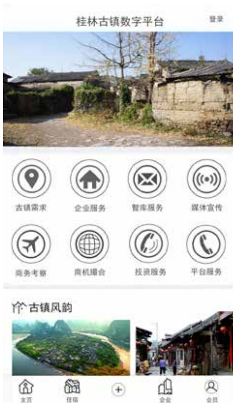
图7 桂林古镇数字平台