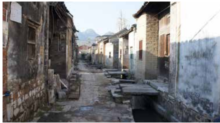
图1 桂林大圩镇熊村现状

自然性破坏多指因村民外出工作、迁入城镇而导致房屋年久失修，辅以暴雨、泥石流等极端天气致使村落受自然侵蚀而遭到破坏。一方面，原有村落的建筑结构、街巷空间、河道及植被缺少人工维护，使传统村落建筑风貌和文化印记逐渐消失。另一方面，基于城镇化给人们带来的生活环境、生活内容与生活观念的改观，相关公共设施已远不能满足居民的基本需求，这也是导致越来越多传统村落沦为“空心村”的主要原因（见图1、图2）。