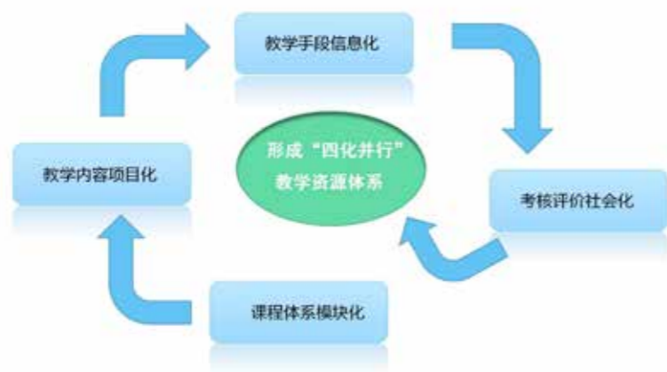
图2 “四化并行”培训教学资源体系示意图

根据区域城镇化建设和建筑业产业发展情况、农民文化水平，结合农民的创业意向，构建了课程体系模块化、教学内容项目化、教学手段信息化、考核评价社会化的“四化并行”培训教学资源体系。开发砌筑工等培训项目20个，“安全生产知识”等课程模块28个，编写钢筋工等建筑工种培训讲义20本。培训项目实用性、针对性强，与建筑业产业发展、新技术、新工艺紧密吻合；课程模块可根据培训对象灵活组合；讲义图文并茂、通俗易懂、与时俱进，学员看得懂、学得进、用得上。开发广西理工职业技术学院建设领域人才教育培训平台，涵盖钢筋工、砌筑工、抹灰工、砌筑工等7个工种，以及施工员、安全员、质量员等13个现场专业人员的教学视频及相关资源，方便学员自主学习（见图2）。