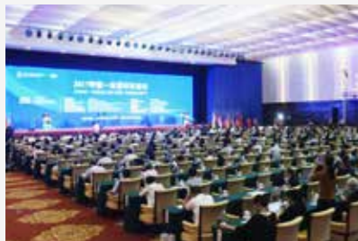
2017年中国—东盟市长论坛现场

本届论坛设两个议题：抓住“一带一路”机遇，促进中国—东盟城市旅游合作及中国与东盟国家共建智慧城市，推动“一带一路”建设。