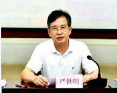
住房城乡建设厅厅长严世明出席会议并讲话

9月21日，住房城乡建设厅召开2017年乡镇污水处理设施项目建设工作座谈会，会议对全区乡镇污水处理设施项目建设情况进行通报，对建设进展滞后的单位提出批评，同时部署下一步工作计划。住房城乡建设厅厅长严世明出席会议并讲话。