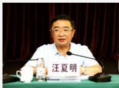
住房城乡建设厅巡视员、副厅长汪夏明出席会议并讲话

本完成；屋顶整治和景观节点村屯、风光带建设在9月30日前基本完成；沿路沿线（包括城市、集镇部分）的整治在10月10日前完成。